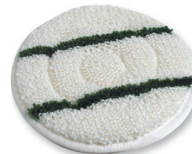
Queen Bonnet Pad, erzielt auf Teppich und Teppichböden beste Reinigungsergebnisse. Art.-Nr. 201.009