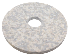
Duo Pad. Art.-Nr. 201.077