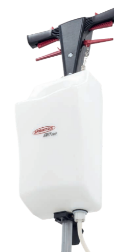
Alle Bedienelemente sind am ergonomisch geformten Handgriff untergebracht.