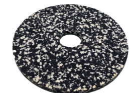
Power Pad. Art.-Nr. 201.076