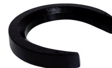
Zusatzgewicht 14 kg. Art.-Nr. 201.068