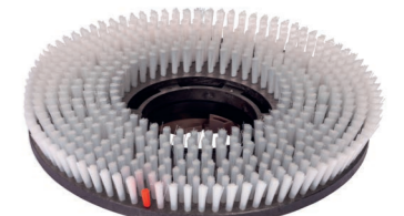
Schamponierbürste. Art.-Nr. 205.120