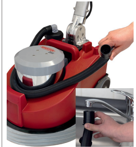
Frischwassertank kann mittels Stretschlauch direkt am Wasserhahn befüllt werden.