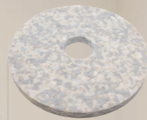
Duo Pad. Art.-Nr. 201.077