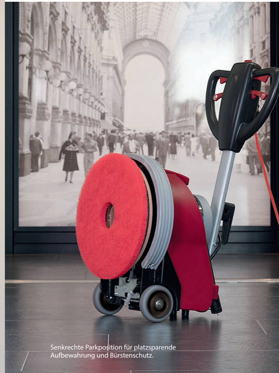
Senkrechte Parkposition für platzsparende Aufbewahrung und Bürstenschutz.