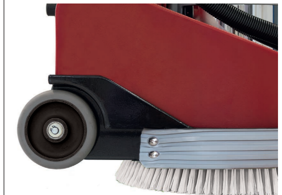
Große, nach hinten versetzte gummierte Räder für einfachen und geräuscharmen Transport.