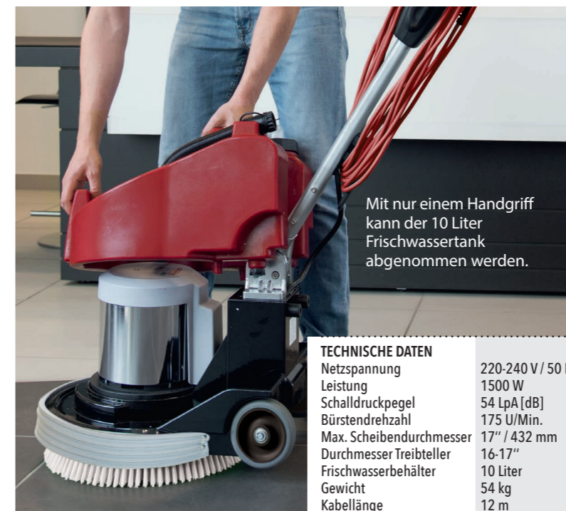
Mit nur einem Handgriff kann der 10 Liter Frischwassertank abgenommen werden.