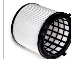
Serienmäßig: HEPA 13 Feinstaub-Filterpatrone. Art.-Nr. 109.058