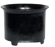
Serienmäßig: Zykloneinsatz. Art.-Nr. 109.057